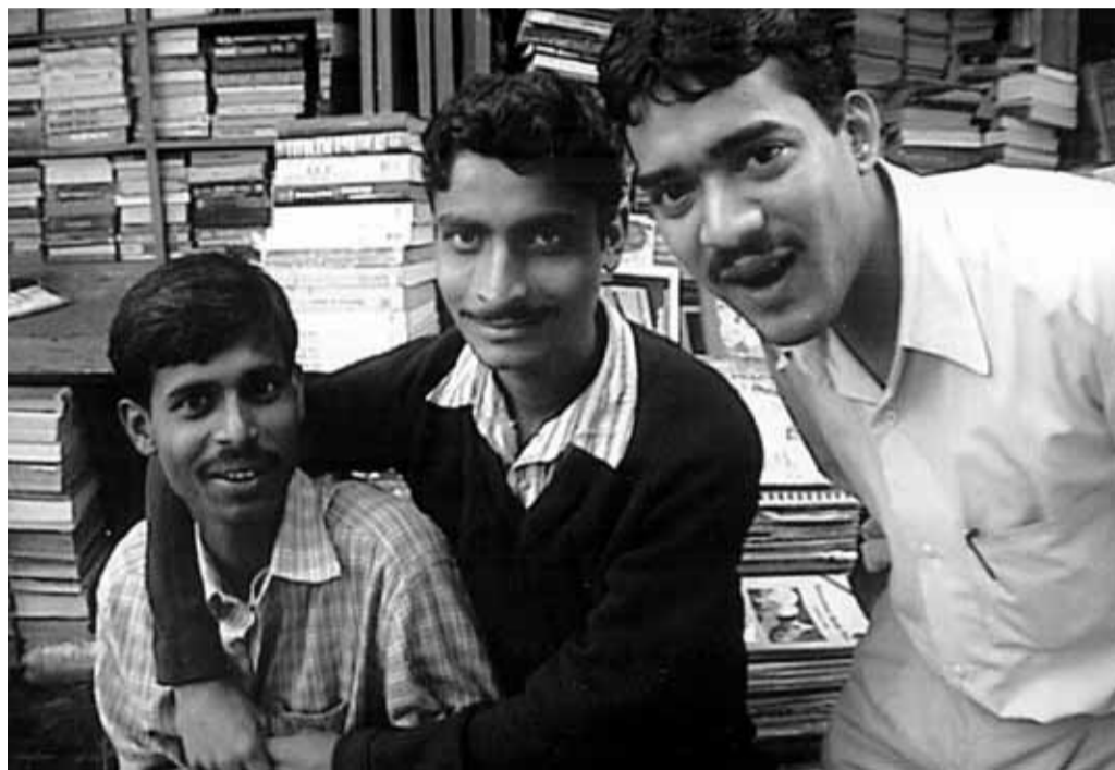
Tres estudiantes de electrónica de Gobaranga comprando libros en College Street, Calcuta